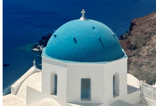
Iglesia griega en Oia

Si no supiéramos el significado que dan los griegos a esta palabra, no tendríamos que hacer nada más que mirar cualquier iglesia griega, y veríamos en lo alto del edificio por fuera una cruz , ¡no un palo!