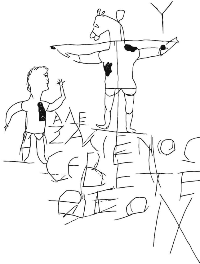
Calco del grafito esculpido en la pared

Según una interpretación, la figura en la imagen tiene la cabeza de un asno para burlarse de las creencias cristianas.